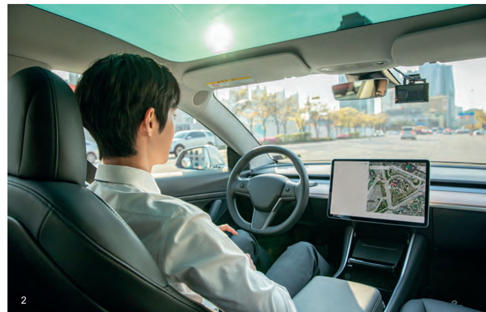
2 운전자가 조작하지 않아도 목적지까지 스스로 운행하는 무인자동차 시대가 열리고 있다.

4차 산업혁명은 초연결성과 초지능화로 산업구조를 변화시키고 새로운 사업모델을 만들어 가고 있다. 초연결성으로 주변 데이터들이 수집되고 분석되어 새로운 가능성에 대한 타진이 끊임없이 이루어진다. 산출된 데이터는 인공지능으로 처리한다. 사람처럼 데이터를 분석하고 처리하는 능력을 가지는 인공지능은 냉장고에 탑재되어 온도를 조정하고 다 떨어진 식료품을 확인하고 알아서 주문한다. 청소기에 탑재되어 장애물도 피하고, 스피커에 탑재되어 날씨도 알려주고 말동무도 되어 준다. 이러한 소통으로 매 순간 사람과 사물 네트워크는 수많은 빅데이터를 생산한다. 기기가 지능화되고 편리화 되는 한편 항상 네트워크로 연결되는 환경에서는 어디서든 해킹의 위협에 노출될 수 있고 정보의 이용의 차별로 양극화문제가 심화될 수 있다. 또한 4차 산업혁명은 주요기술의 융합과 복합으로 산업전반에 변화의 바람을 일으킨다. 지능을 탑재한 기기들이 제조업에 투입되어 기계화될 것이므로, 생산과 품질분야의 단순 기능을 반복하는 일자리가 사라지게 된다. 인공지능을 탑재한