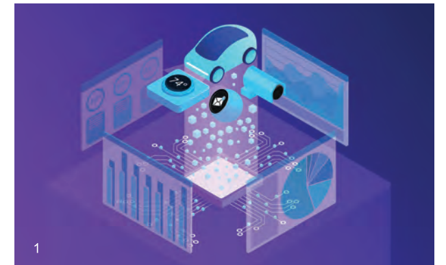
1 사물인터넷은 센서를 사물에 부착하여 네트워크에 연결하는 것으로 사람의 개입 없이 사물 상호간에 데이터를 교환할 수 있다.

일본의 경우는 2013년 정부가 세계 최첨단 IT국가를 선언하여 IT를 경제 성장의 엔진으로 활용하겠다는 선언을 하였다. 2015년에는 로봇을 새로운 전략으로 추가하여 저출산 고령화로 부족해진 인력과 사회문제를 풀어보고자 하였다. 과학기술 이노베이션 종합전략으로 정부가 나서서 4차 산업혁명기술(IoT, 빅데이터, 인공지능, 로봇 등)을 활용하는 새로운 제조시스템 구축을 기획했다. 2016년부터는 국가혁신프로젝트로 4차 산업혁명 선도전략을 발표하며 기술과 산업구조 개혁에 매진하고 있다.